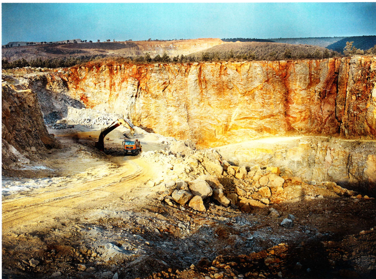
Smalko smilšu ieguve raktuvēs ir alternatīva krasta smilšu smelšanai, piemēram, pludmalēs. Tomēr uz vidi atstātās sekas nav mazāk postošas.