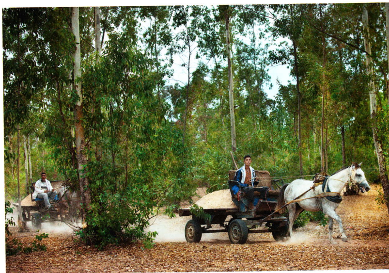
Ben Slimane mežs netālu no Kasablankas pieder Marokas dabas mantojumam, tomēr arī šeit darbojas 18 raktuves, kur strādniekus nodarbina daļēji nelikumīgi.

„Mašīnu piekraujot, mēs sagatavojam sešiem kubikmetriem smilšu nepieciešamo dokumentāciju, bet īstenībā ielādējam divpadsmit kubikmetrus,” pastāsta kāds šoferis, kurš te strādā jau trīs gadus. „Pie izbrauktuves uzstādītie svāri praktiski visu laiku izrādās salūzuši. Un neviens nekad neuzdod nekādus jautājumus,” viņš apgalvo.