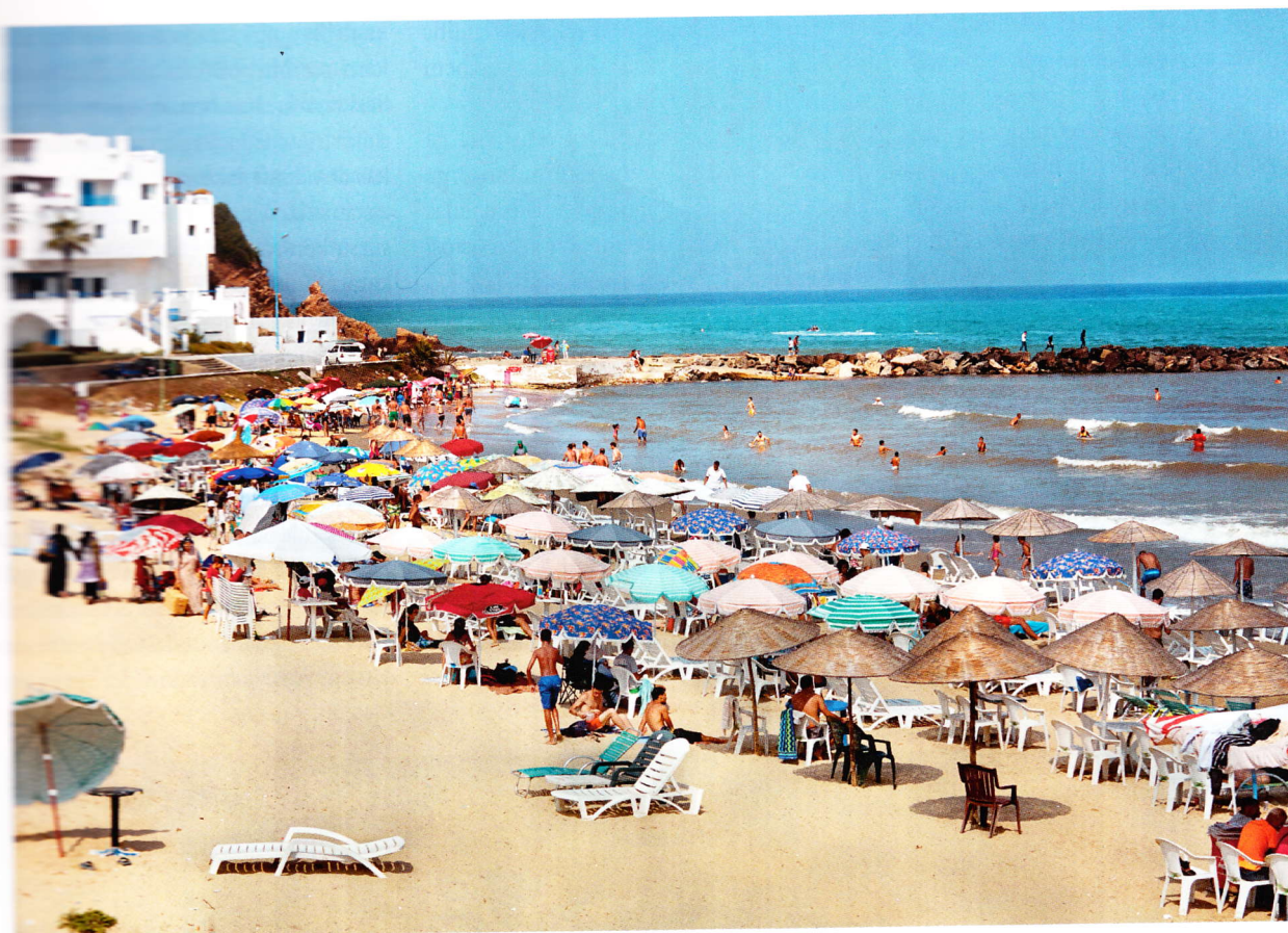
Pludmales dzīve Tetuānā: Marokas tūrisma nozare augtin aug, un līdz ar to palielinās arī jaunu mitekļu un viesnīcu skaits. Pieprasījums pēc smiltīm celtniecībai ir liels, un līdz pat 40 procentiem šī pieprasījuma apmierina melnais tirgus.

gadījumi. Taču ģimenēm samaksā, lai tās tur moti, un viss turpinās tā, it kā nekas nebūtu noticis.”